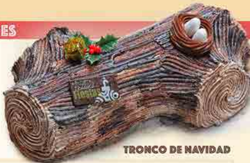
TRONCO DE NAVIDAD