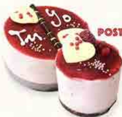
POSTRES SAN VALENTÍN