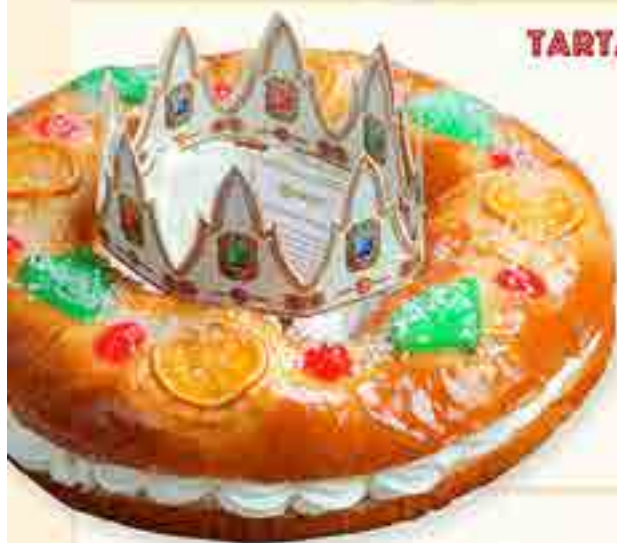
ROSCÓN DE REYES