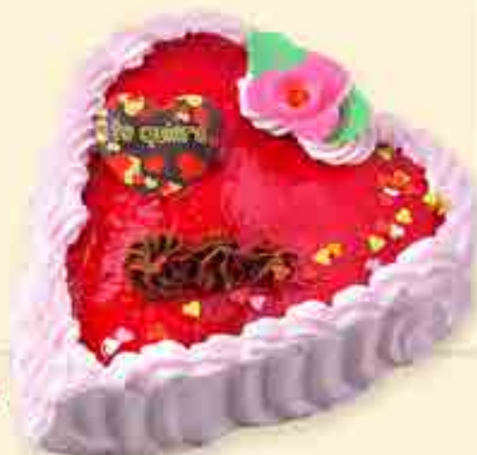
TARTA SAN VALENTÍN