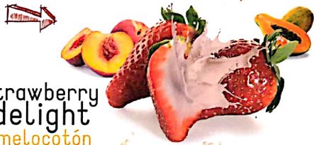
2. strawberry delight melocotón papaya fresa