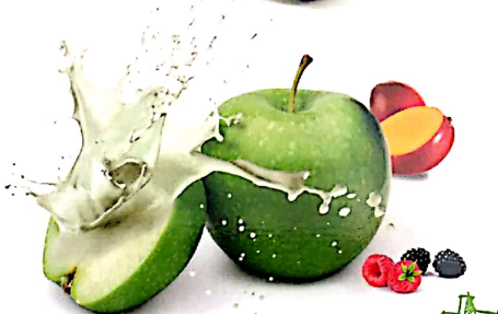
5. raspberry heaven frambuesa manzana mora mango