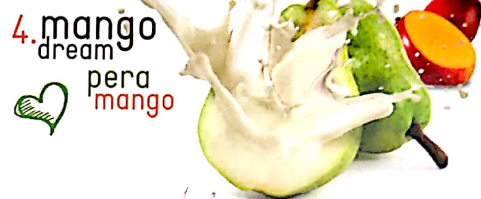
4. mango dream pera mango