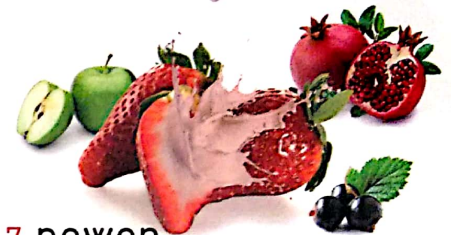
7. power granate granada fresa grosella manzana