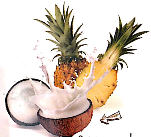
8. coconut crush piña coco