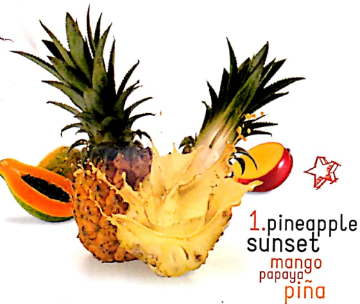
1. pineapple sunset mango papaya piña