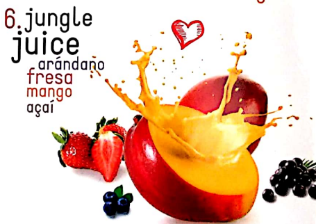
6. jungle juice arándano fresa mango açai