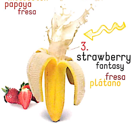
3. strawberry fantasy fresa plátano